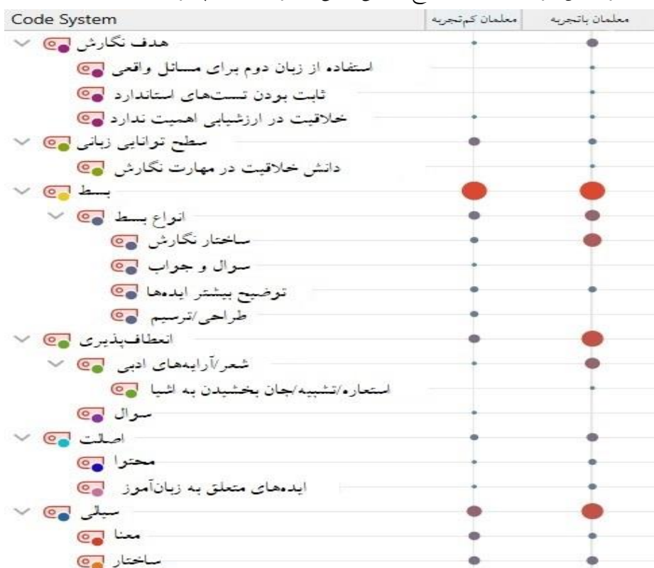
شکل ۱. باور معلمان باتجربه و کم‌تجربه در مورد سنجش خلاقیت در مهارت نگارش

بودند که عنصر بسط از اهمیت بیشتری در سنجش خلاقیت برخوردار است. در واقع، آنان بر این باور بودند که مهم‌ترین عنصر در سنجش خلاقیت، توانایی فراگیران در میزان توضیح دادن ایده‌های آنها است. به عبارتی دیگر، هرچقدر زبان‌آموزان قادر باشند ایده‌های خود را بیشتر توضیح دهند، از میزان خلاقیت بیشتری برخوردارند. همچنین، معلمان باتجربه باور داشتند که عناصر انعطاف‌پذیری و سیالی از دیگر مواردی هستند که باید در بحث سنجش خلاقیت مورد توجه قرار گیرند. در مورد کدهایی که در زیرمجموعه کدهای اصلی یعنی بسط، انعطاف‌پذیری، اصالت و سیالی قرار دارند، معلمان به ساختار نگارش در بحث بسط، استفاده از آرایه‌های ادبی در بحث انعطاف‌پذیری و سیالی در ساختار اشاره داشتند. اگرچه اصالت به‌عنوان یکی از عنصرهای اصلی خلاقیت از دیدگاه گیلفورد و دیگر پژوهشگران این حوزه محسوب می‌شود، معلمان باتجربه، این عنصر را آن‌چنان مهم نمی‌دانستند. از طرفی دیگر، معلمان کم‌تجربه همانند معلمان باتجربه، عنصر بسط را در سنجش خلاقیت مهم می‌دانستند. بعد از آن، به عنصر سیالی (سیالی در ساختار و معنا) به یک میزان اشاره کردند. برای این گروه از معلمان، سطح توانایی زبانی بیشتر از انعطاف‌پذیری و اصالت اهمیت داشت.