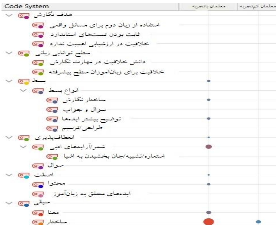
شکل ۲. عملکرد معلمان باتجربه و کم‌تجربه در مورد سنجش خلاقیت در مهارت نگارش

به منظور بررسی نحوه عملکرد معلمان باتجربه و کم‌تجربه زبان انگلیسی در مورد سنجش خلاقیت در مهارت نگارش فراگیران، از معلمان خواسته شد تا نمونه‌ای از نگارش فراگیران که آن را ارزیابی کرده‌اند در اختیار پژوهشگران این مطالعه قرار دهند. بعد از بررسی و کدگذاری نمونه‌های ارسالی، از Code Matrix Browser (CMB) در سطح اسناد گروهی (عملکردها) استفاده شد. شکل ۲ نشان‌دهنده نتایج مربوطه است. همان‌طور که در این شکل نشان داده شده است، معلمان کم‌تجربه در خصوص سنجش خلاقیت در مهارت نگارش فراگیران عملکردی نداشتند. به عبارت دیگر، این گروه از معلمان تنها به ارزیابی عنصر سیالی (سیالی در ساختار) متن نوشته شده، پرداخته بودند و دیگر عناصر مربوط به خلاقیت را مورد سنجش قرار ندادند. در مورد عملکرد معلمان باتجربه، نتایج نشان داد که این گروه از معلمان به سیالی در ساختار توجه ویژه‌ای داشتند. سپس، استفاده از آرایه‌های ادبی را مورد سنجش قرار داده بودند. سیالی در معنا، بسط در ساختار نگارش، توضیح بیشتر ایده‌ها، اصالت در محتوا و انعطاف‌پذیری از دیگر مواردی بودند که معلمان باتجربه در ارزیابی نگارش فراگیرانشان، به آن‌ها توجه کرده بودند.