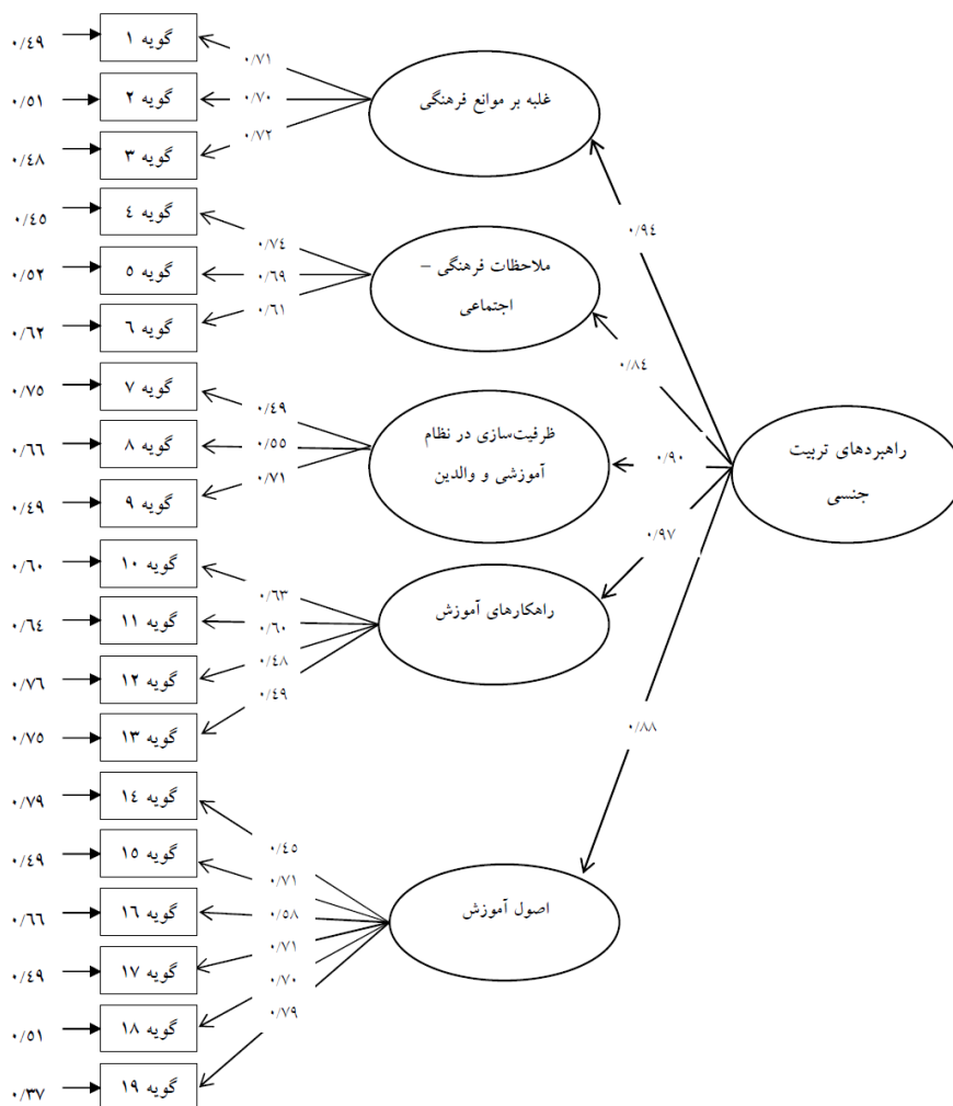
شکل ۲. مدل مرتبه دوم اندازه‌گیری راهبردهای آموزش تربیت جنسی در حالت تخمین استاندارد شده

برازش (GFI) برابر با ۰/۹۸؛ شاخص تعدیل شده نکویی برازش (AGFI) برابر با ۰/۸۷؛ شاخص برازش هنجار شده بنتلر بونت (NFI) برابر با ۰/۹۶؛ شاخص برازش تطبیقی (CFI) برابر با ۰/۹۸؛ شاخص برازش افزایشی (IFI) برابر با ۰/۹۸ بودند. بر این اساس، می‌توان نتیجه گرفت که ابزار راهبردهای آموزش تربیت جنسی نوجوانان از برازش بسیار مطلوبی برخوردار است.