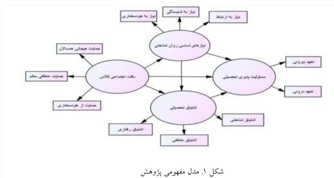
شکل ۱. مدل مفهومی پژوهش

در این راستا، پژوهش حاضر در صدد آزمون این فرضیه است: بافت اجتماعی کلاس به واسطه ارضای نیازهای اساسی روان‌شناختی و اشتیاق تحصیلی بر مسئولیت‌پذیری تحصیلی اثر ساختاری غیرمستقیم دارد. مدل مفهومی پژوهش حاضر در شکل شماره یک نشان داده شده است.